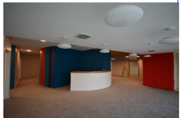
Hall d'entrée (RDC côté Nord)