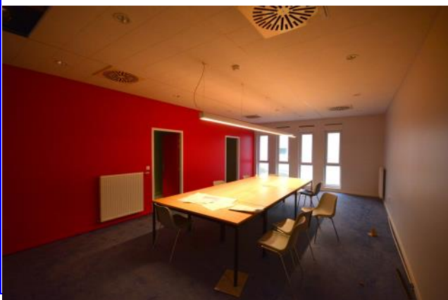
Salle de réunion

Nous aurions souhaité pouvoir faire visiter aux familles ce magnifique nouveau lieu d'accueil et d'hébergement. Mais la COVID impose ses règles, et dès que les conditions sanitaires le permettront, une inauguration sera bien sûr organisée pour permettre aux familles de visiter cette superbe résidence, qui comme pour les locaux de l'ESAT, améliorera les conditions d'hébergement de tous les travailleurs de l'ESAT qui y seront logés.