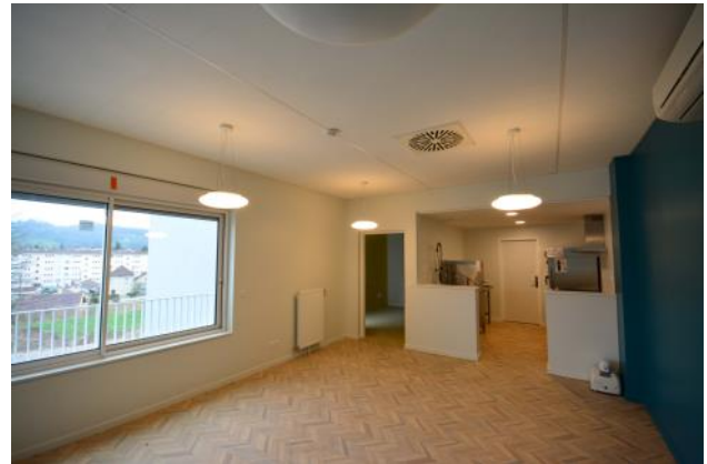
Espace de vie d'une unité de vie (restauration + activités)

Dès le 10 mars, les chambres ont été réparties entre les résidents selon des critères préalablement définis, tout en répondant aux obligations, parfois incontournables, et dans la mesure du possible, aux désirs des futurs résidents.