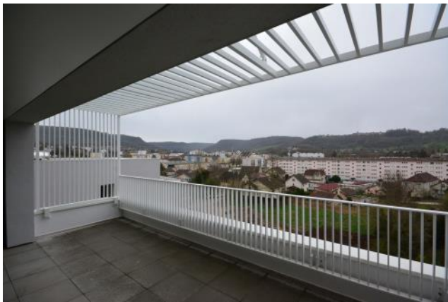
Balcon donnant côté Sud (plateau Montaigu)

Il y aura aussi des « salles familles » où les résidents pourront accueillir leurs amis et familles pour partager un repas.