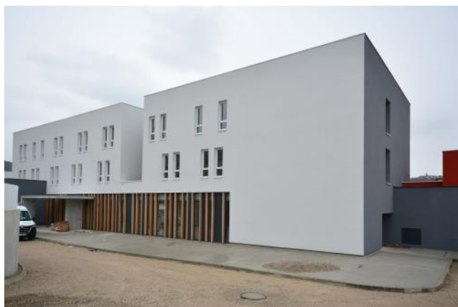
Façade résidence VIVA-CITÉ côté Nord (Hall d'entrée RDC)

La résidence VIVA-CITÉ, voilà quelques années qu'on en parle ! Le principe de la construction d'un nouveau foyer, en remplacement de celui du Château d'eau devenu vétuste et inadapté, a été acté par le Président du Conseil Départemental de l'époque, en 2014, Monsieur PERNY.