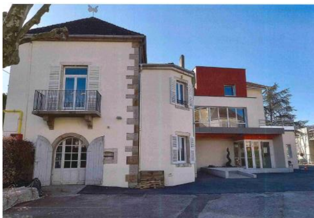
Nouvel accueil IME

Le challenge était d'exécuter les travaux en maintenant l'activité de l'établissement, en réalisant tranche par tranche, sans trop perturber la vie de tous au quotidien. Pour ne pas trop perturber le quotidien des enfants, nous avons utilisé les anciens locaux de l'ESAT 1 pour les activités de jour. Ces locaux ont été rendus disponibles après le déménagement du pôle travail dans ses nouveaux locaux.